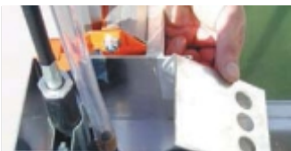
POMPA MECANICA DE APA