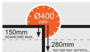
ADANCIME MAX. TAIERE