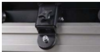
PROFILE DE ALUMINIU