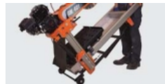
USOR DE TRANSPORTAT